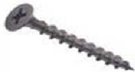
Саморез 3,5x35 Код 043

4. Саморезами 3,5x35 к полке в сборе прикрепить навески. С помощью навесок закрепить полку к стене саморезами 3,5x35 или самостоятельно креплением, которое зависит от характера стены.