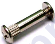
Стяжка межсекционная 8x32 Код 013