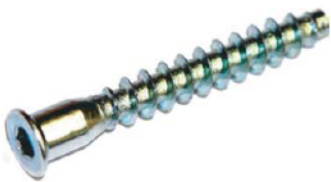
Евроинт 6,3x50 Код 021

1. Согласно схеме, собрать полки в отдельности.