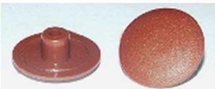
Заглушка для евроинта Код 061

4. Саморезами 3,5x35 к полке в сборе прикрепить навески. С помощью навесок закрепить полку к стене саморезами 3,5x35 или самостоятельно креплением, которое зависит от характера стены.