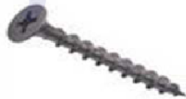
Саморез 3,5x35 Код 043

3. С помощью навесок закрепить полку к стене.