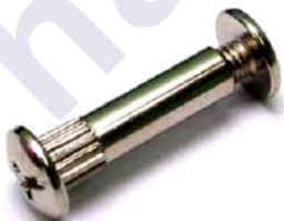
Стяжка межсекционная 8x32 Код 013

3. С помощью навесок закрепить полку к стене.