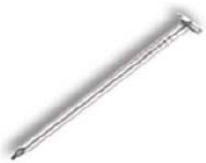
Гвоздь Код 046

1. Соединить бока 1 со стенками горизонтальными 2.