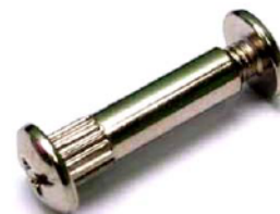
Стяжка межсекционная 8x32 Код 013