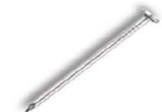
Гвоздь Код 046